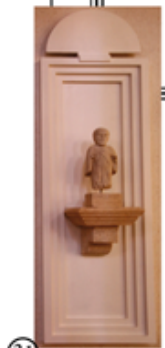
31 San Ulderico statua del 1300