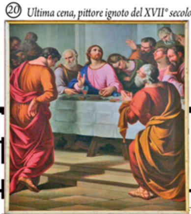
20 Ultima cena, pittore ignoto del XVII° secolo