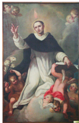
17 S. Vincenzo Ferreri, pittore ignoto XVII° secolo, restaurato dal