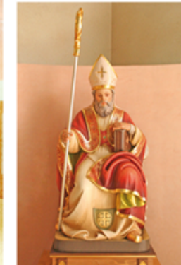
29 S. Martino Vescovo