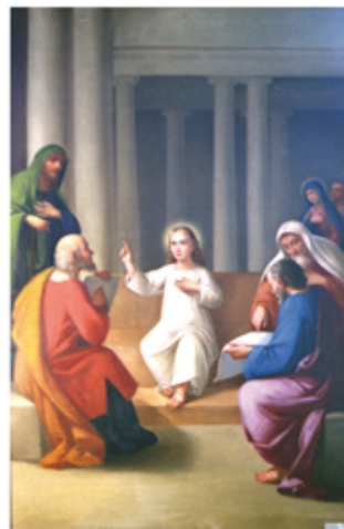
19 Gesù tra i dottori, pittore A. Salomoni XVIII° secolo, restaurato dal Gruppo Alpini Povegliano anno 2004