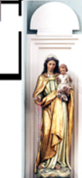
23 Madonna con bambino