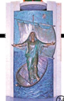
24 Gesù che cammina sulle acque, formella in bronzo