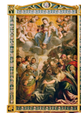
01 Miracolo di S. Martino, pittore Zeno Donato detto il Donise anno 1605