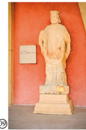
09 Statua di S. Martino in paramenti vescovili. Opera dello scultore Grigoli, del XVIII° secolo, recuperata dall'Ass. Balladoro nell'anno 1984 dal fiume Via Mora, restaurata e posta sulla gradinata l'anno 2007 dal Gruppo Giovani Povegliano.