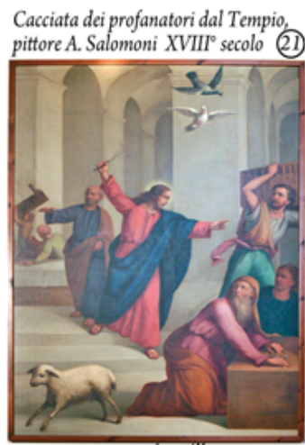
Cacciata dei profanatori dal Tempio, pittore A. Salomoni XVIII° secolo