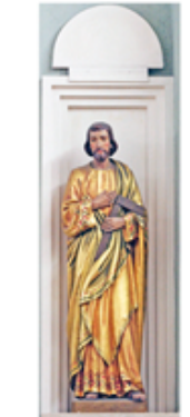
28 S. Giuseppe