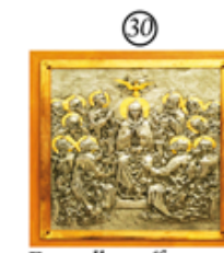
Formella raffigurante la discesa dello Spirito Santo sugli Apostoli