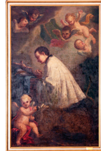
08 S. Luigi Gonzaga in preghiera, pittore ignoto, tela del XVII° secolo, restaurato dal Gruppo Alpini Povegliano anno 1978