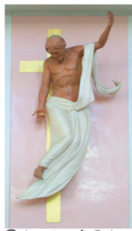
25 Ascensione di Gesù in cielo