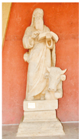
15 S. Luca Evangelista, opera del XVIII° secolo, dello scultore Grigoli restituita dal sig. Luca Cordioli nell'anno 2006, restaurata e posta sulla gradinata dal Gruppo Giovani Povegliano nel 2007