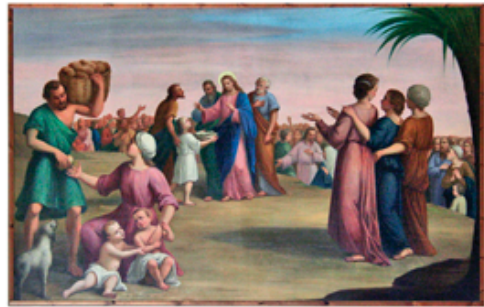
22 La moltiplicazione dei pani, tela di A. Salomoni XVIII° secolo