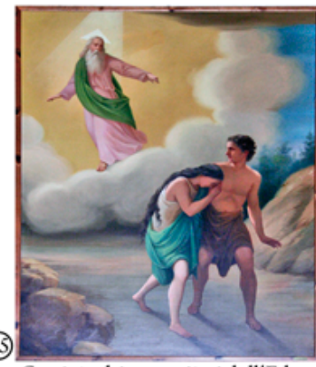
05 Cacciata dei progenitori dall'Eden, pittore A. Salomoni XVIII° secolo