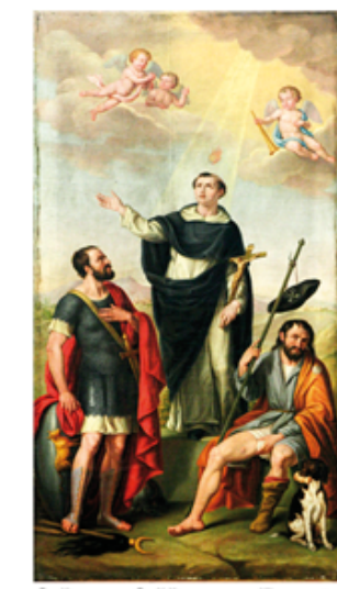
07 S. Rocco, S. Vincenzo Ferreri, S. Bovo, opera del pittore Lorenzo Muttoni, anno 1852