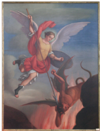
18 Arcangelo Michele contro Lucifero, pittore A. Salomoni XVIII° secolo, restaurato A.N.T.E.A.S. la madonnina anno 2004