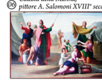
06 Caduta della Manna, pittore A. Salomoni XVIII° secolo

Profeta: Geremia il pianto di Rachele, pittore A. Salomoni XVIII° secolo restaurato anno 2000 Profeta: Daniele nella fossa dei leoni, pittore A. Salomoni XVIII° secolo restaurato dal dott. Roberto Ciresa anno 1994 Profeta: Ezechiele visione delle ossa aride, pittore A. Salomoni XVIII° secolo restaurato dall'A.R.T.E.A. La Madonnina anno 1998. Profeta: Isaia la sua predicazione, pittore A. Salomoni XVIII° secolo restaurato dal sig. Mario Savio anno 1996.