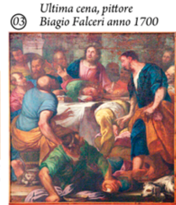
03 Ultima cena, pittore Biagio Falceri anno 1700