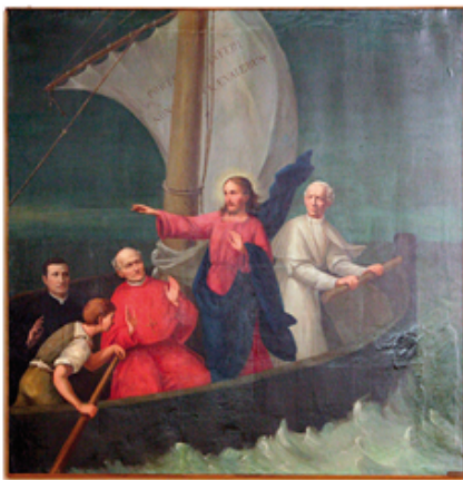
16 La tempesta sedata, pittore A. Salomoni XVIII° secolo, restaurato da Perbellini-Rizzotti anno 1978